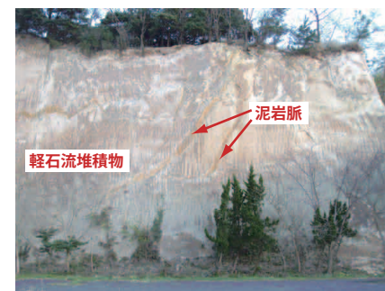
写真2：青果市場裏の露頭

図2の大田市駅近くの青果市場駐車場でよく見られますが、いずれも茶褐色を呈しており(写真2)、細粒土がほとんどですが(写真3)、一部細かな軽石を含んでいます。ここでは根元は見られませんが、旧河成層(現在は周囲に河道は位置していません)中の軟質な粘性土層が上位の軽石流の底面を取り込んで亀裂面に圧入したもの、またはこの軽石流より前の火砕流堆積物が同じ亀裂面に圧入したものではないかと考えられます。