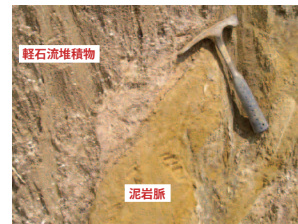
写真3：ここでの泥岩脈は細粒土からなる