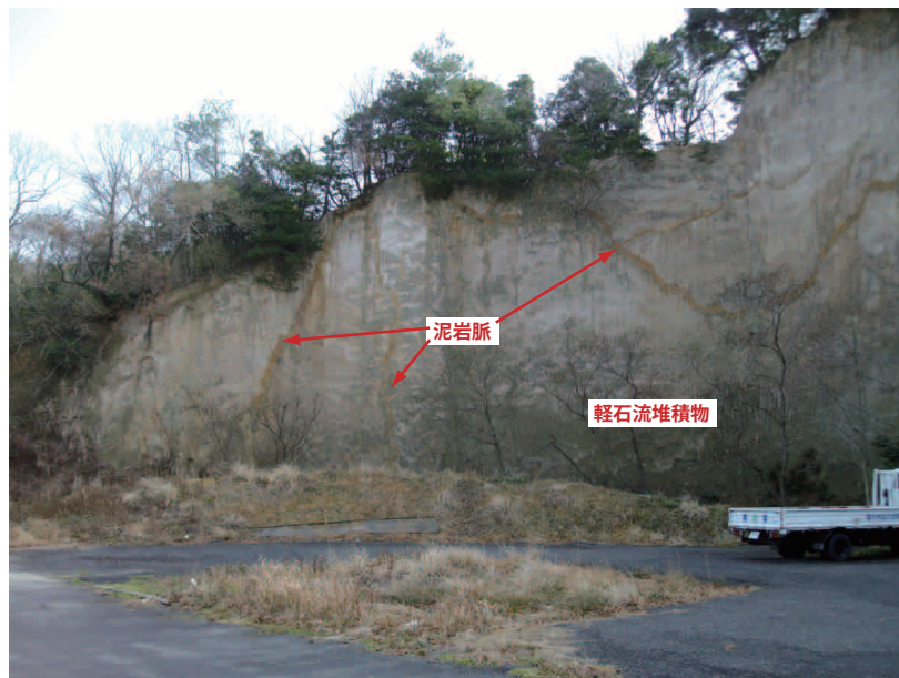
写真1：軽石流堆積物層中に分布する泥岩脈。崖面に直交したり、斜交するものなど衝立上に種々あり規則性は認められない。

三瓶火山より約 20 km の下流に位置する J R 大田市駅周辺の駐車場沿いの崖面には、約 4.5 万年前に同火山から噴出し、延々と流下堆積した軽石流堆積物が露出しています(推定層厚 30 ~ 40m)。この堆積物中には、写真1に示すように、幅 0.3 ~ 0.5m 程度の泥岩が脈状に貫入しています。軽石流堆積物層直下の谷底堆積物や河川成堆積物中の粘性土が、軽石流堆積物の堆積後の地震や冷却作用によって発生した亀裂を通して、地表まで貫入したものではないかと考えられています。亀裂幅を約 40cm も押し広げる水平力を有する自然の力には大変驚かされます。