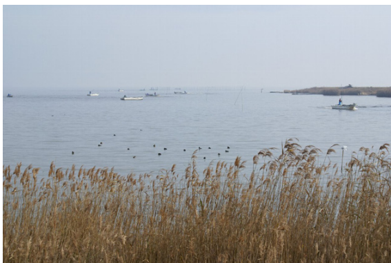
写真2：斐伊川河口付近の宍道湖風景

宍道湖は氷河時代の海面低下時には陸地であり、海面上昇により海の内湾となり、斐伊川からの土砂により出雲市側が埋められて一時的に淡水湖となった後、大橋川、佐陀川の開削により海水の混じった現在の汽水湖となりました。汽水湖の特性より、あまさぎ、白魚など「宍道湖七珍」といわれる水産物に恵まれており、特にしじみは全国生産量の約4割を占めており有名です。また宍道湖は国内有数の水鳥飛来地で 240 種以上の鳥類が生息しており、その生態環境を守るため平成 17 年に中海とともにラムサール条約に登録されました。