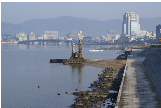
写真1：宍道湖と松江市中心街。湖と街がほどよくなじんでいる。

宍道湖は日本国内で 7 番目の面積を持ち、周囲長 47km で東西に長い長方形をしており、最大水深は 6.4m で面積の割りに非常に浅い湖といえます。美しい夕日とともにさまざまな水辺の景観を作り出して、古来文人・墨客を魅了するとともに、漁業、水運、水利などで地域の人々の生活と密接な関係を持ってきました。