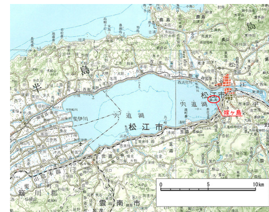
国土地理院発行 1:25000 地形図 「大社」「松江」を使用